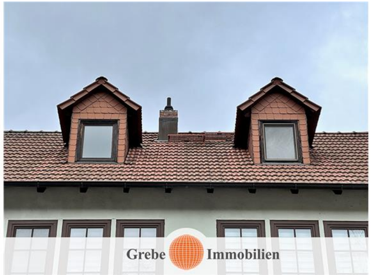
DG als 4. Etage